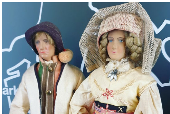
Trachtenpuppen Schweden (Internat. Trachtenpuppensammlung)

Alle Informationen unter www.spielzeugmuseum-neustadt.de