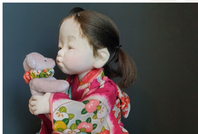
Zeitgenössische Figurenkunst aus Japan